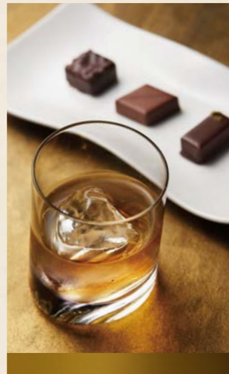
ウイスキーセット ¥2,420