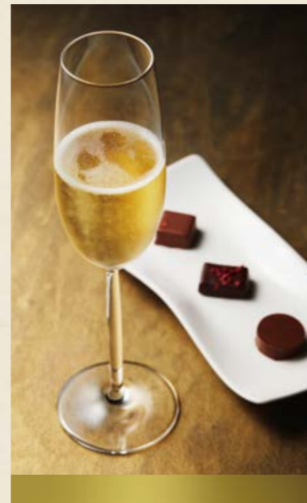
シャンパーニュセット ¥2,585