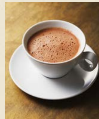
Bean to Cocoa ¥1,650

パレドオールではドリンクやケーキの テイクアウトをご用意しております お気軽にお声がけください