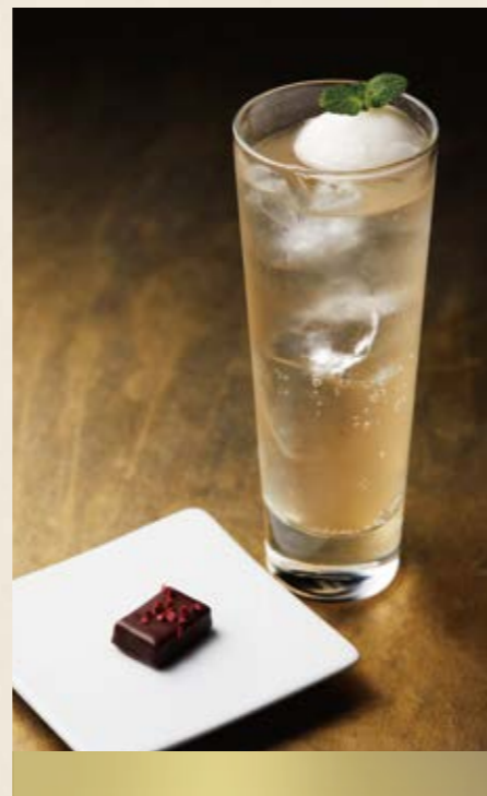
ショコラ ネスパ?! セット ¥1,265

カカオ豆から独自の製法で作った 爽やかなショコラの香りと味を楽しめる 全く新しいパレドオールオリジナルの 炭酸ドリンクです