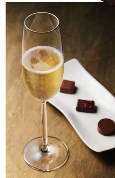
シャンパーニュセット ¥3,465 税込