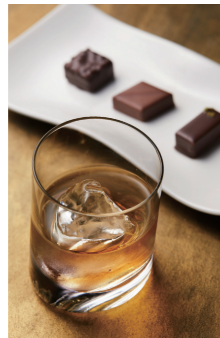
モルトセット ¥3,333 税込

トッピングするシャーベットをお選びください。 ナチュラル(カカオ)/ルージュ(ベリー)/シャンパーニュ