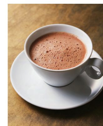
Bean to Cocoa ¥2,134 税込