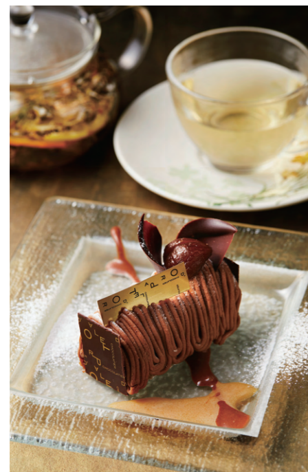
ガトーセット ¥2,178 税込