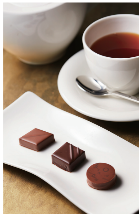
チョコラセット ¥2,178 税込