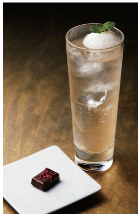
チョコラ ネスパ?! セット ¥1,822 税込

カカオ豆から独自の製法で作った爽やかな チョコラの香りと味を楽しめる全く新しい パレドオールオリジナルの炭酸ドリンクです。